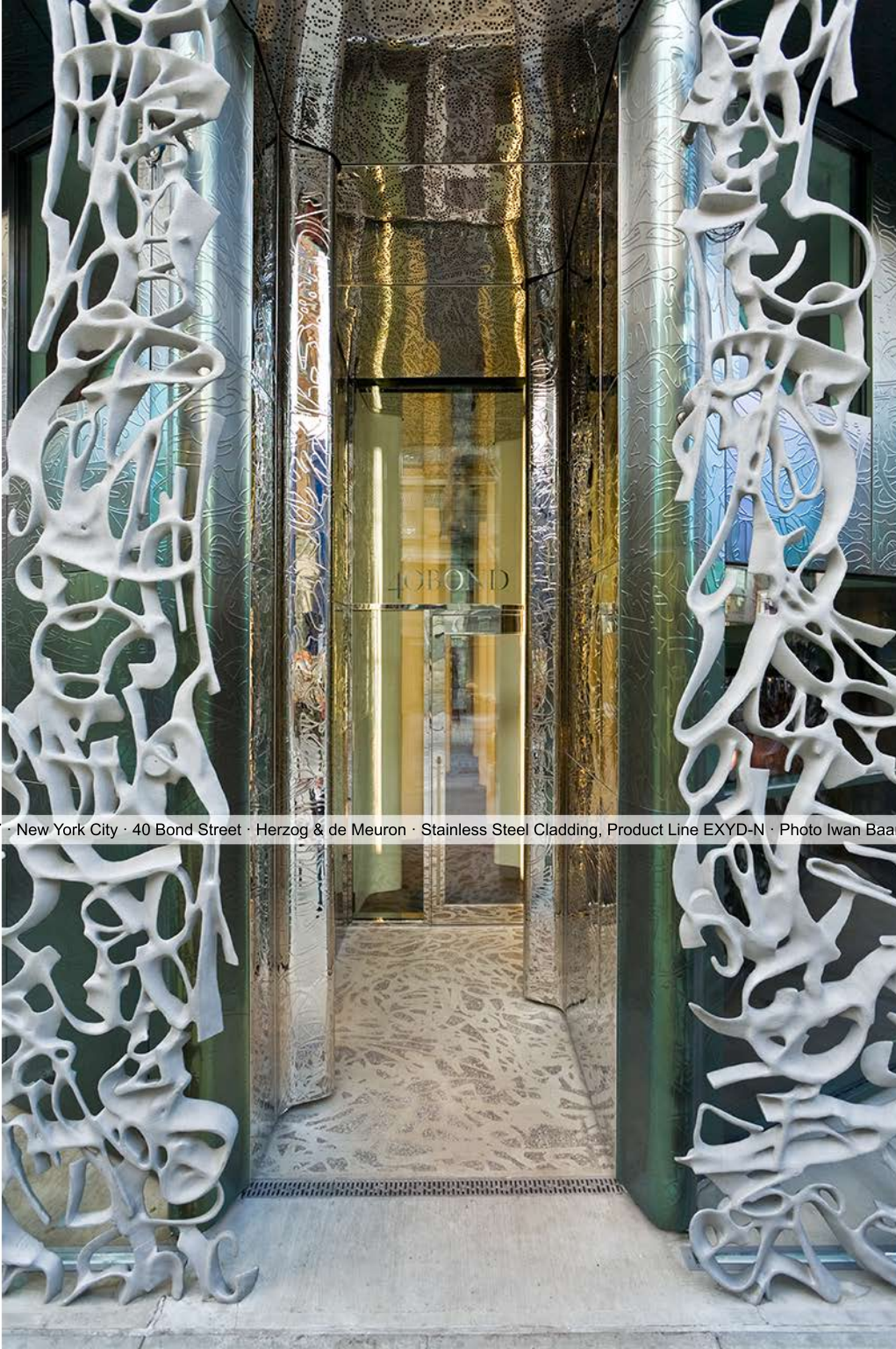
2007 · New York City · 40 Bond Street · Herzog & de Meuron · Stainless Steel Cladding, Product Line EXYD-N