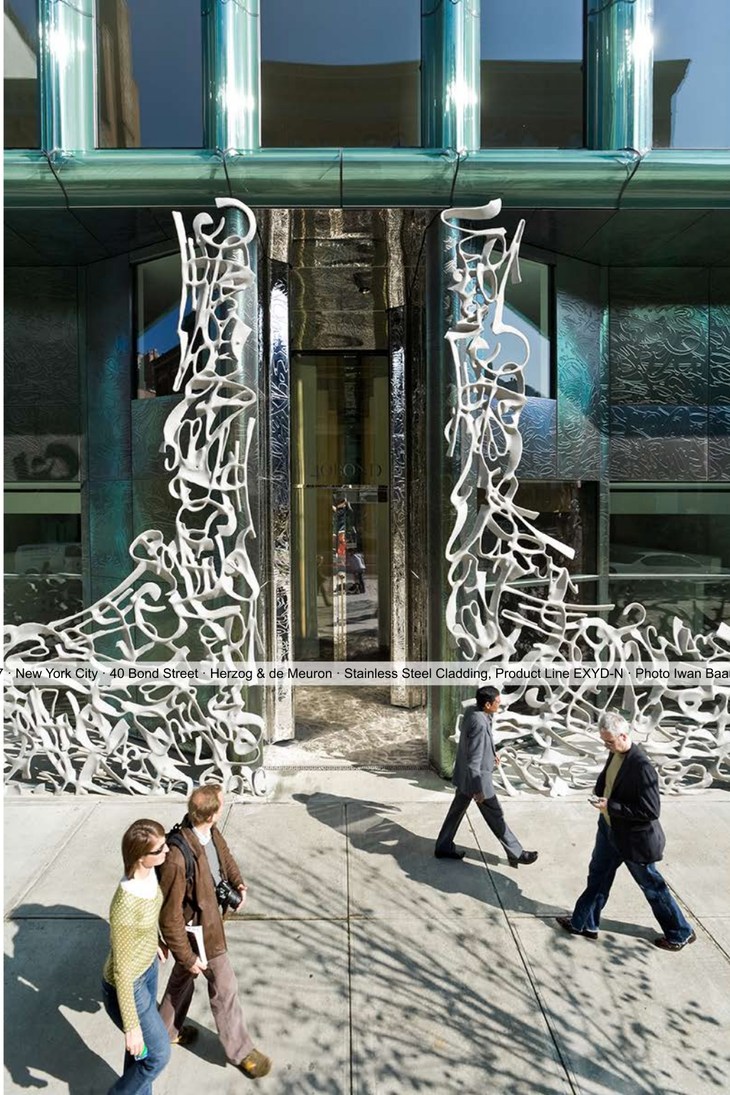
2007 · New York City · 40 Bond Street · Herzog & de Meuron · Stainless Steel Cladding, Product Line EXYD-N · Photo Iwan Baan