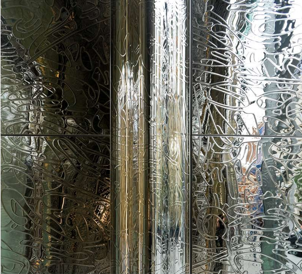
2007 · New York City · 40 Bond Street · Herzog & de Meuron · Stainless Steel Cladding, Product Line EXYD-N · Photo Iwan Baan