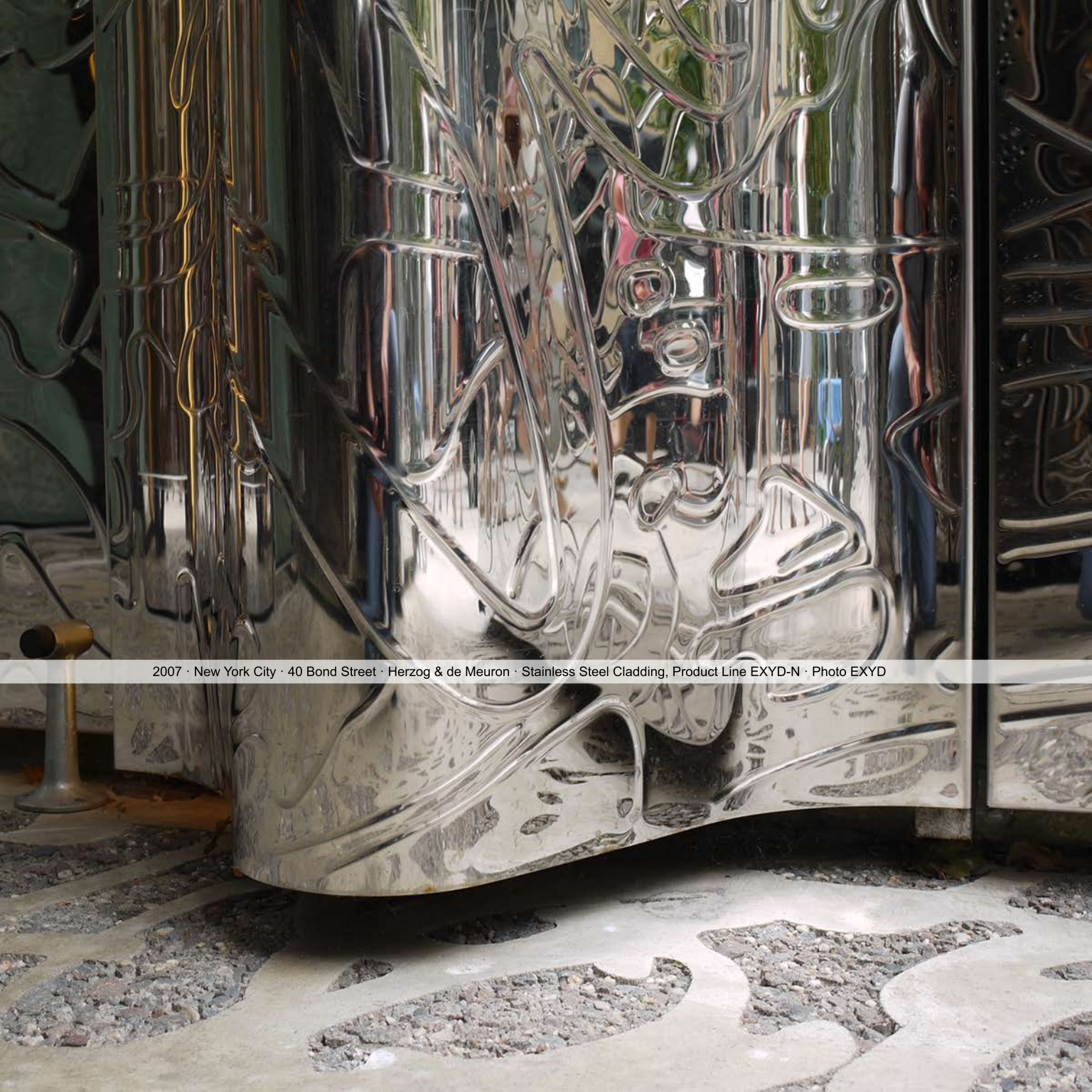
2007 · New York City · 40 Bond Street · Herzog & de Meuron · Stainless Steel Cladding, Product Line EXYD-N · Photo EXYD