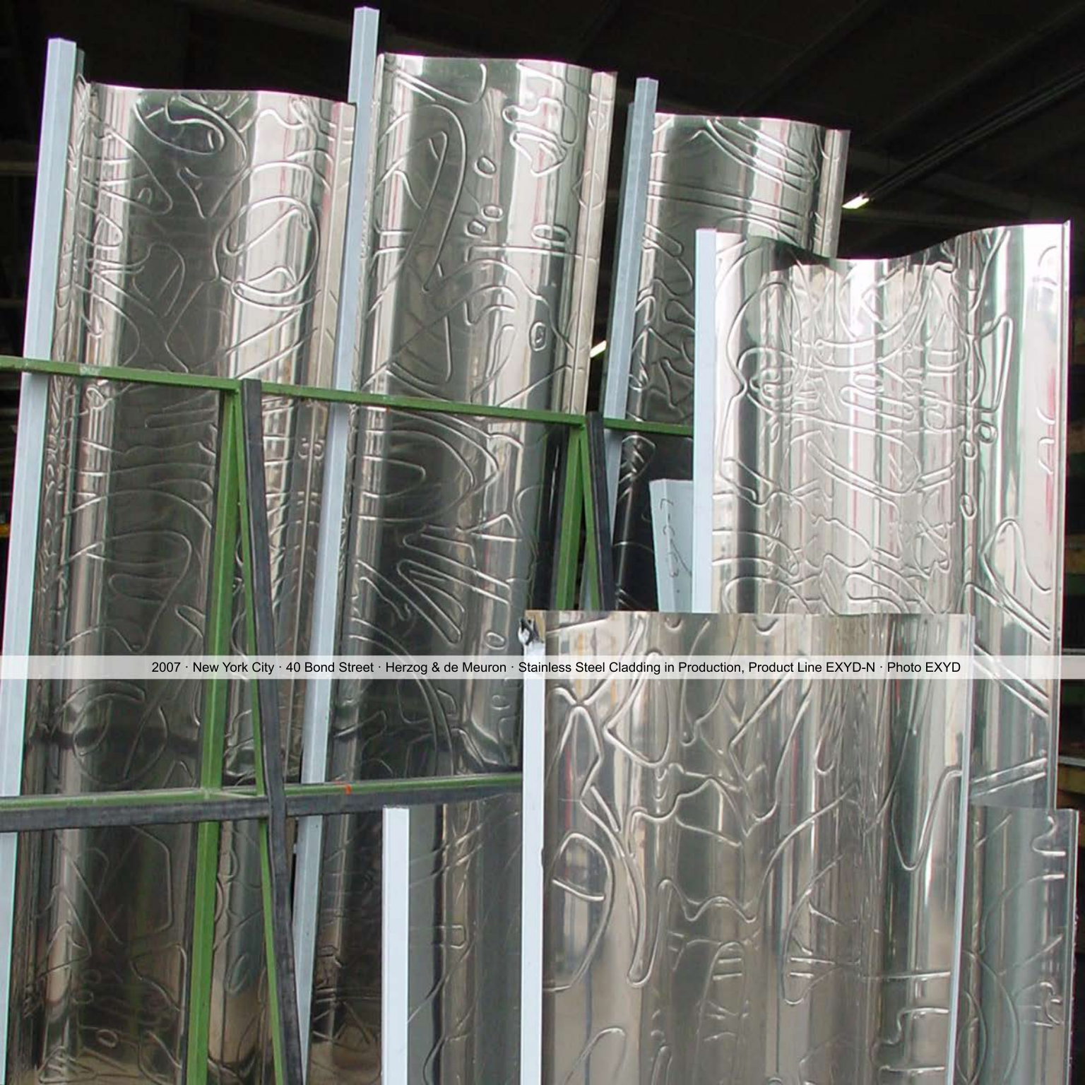
2007 · New York City · 40 Bond Street · Herzog & de Meuron · Stainless Steel Cladding in Production, Product Line EXYD-N